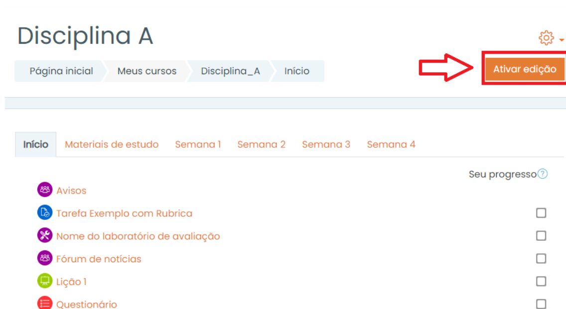
Figura 1. Ativar a edição.

Para adicionar o Guia de Avaliação , acesse a sua sala e ative a edição.