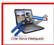
Criar Nova Webquest